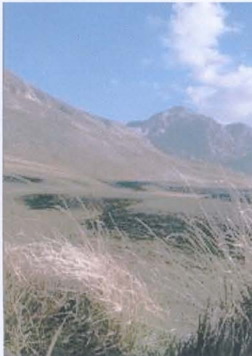
Im kargen Altaigebirge

Die asiatische Medizin ist bei uns durch die Akupunktur, die TCM und ayurvedische Heilkunst bekannt geworden und erfreut sich sehr großer Beliebtheit. Auf dem deutschen Markt ist jetzt auch Maumasilr erhältlich. Dieses Naturheilmittel aus den Bergen Asiens war über hundert Jahre in Vergessenheit geraten. Jetzt, nachdem alle Handelswege wieder offen sind, können auch wir wieder von dem asiatischen Mittel profitieren.