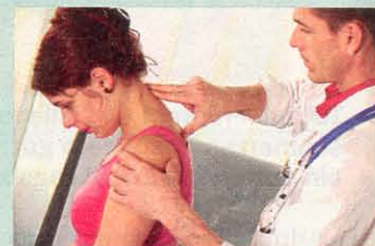
Osteopathen machen die Gelenke mit sanften Griffen wieder beweglich

Therapie In der Regel verschwinden die Beschwerden nach einigen Tagen von selbst. Tun sie das jedoch nicht, ist