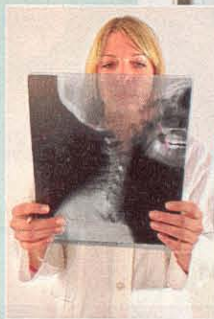
Schwierige Diagnose: Im Röntgenbild ist nichts zu finden

Diagnose Ob wirklich ein Schleudertrauma vorliegt, konnte der Arzt bislang nur anhand der